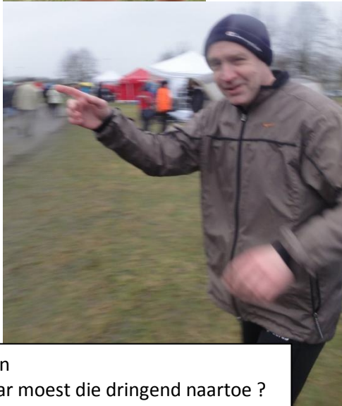
Stein Waar moest die dringend naartoe ?